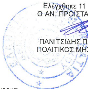
ΠΑΝΙΤΣΙΔΗΣ ΠΑΝΑΓΙΩΤΗΣ ΠΟΛΙΤΙΚΟΣ ΜΗΧΑΝΙΚΟΣ ΠΕ

Ελέγχθηκε 11 / 12 / 2017 Ο ΑΝ. ΠΡΟΪΣΤΑΜΕΝΟΣ Τ.Υ.