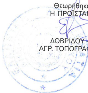
ΔΟΒΡΙΔΟΥ - ΤΖΙΡΑ ΕΛΕΝΗ ΑΓΡ. ΤΟΠΟΓΡΑΦΟΣ ΜΗΧ/ΚΟΣ ΠΕ

Θεωρήθηκε 11/ 12 /2017 Η ΠΡΟΪΣΤΑΜΕΝΗ Δ/ΝΣΗΣ