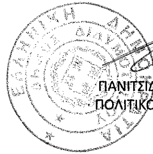
ΠΑΝΙΤΣΙΔΗΣ ΠΑΝΑΓΙΩΤΗΣ ΠΟΛΙΤΙΚΟΣ ΜΗΧ/ΚΟΣ - ΠΕ3

ΕΘΕΩΡΗΘΗ ΔΙΔΥΜΟΤΕΙΧΟ, 22 / 04 2016 Ο ΑΝ. ΠΡΟΪΣΤΑΜΕΝΟΣ Τ.Υ.