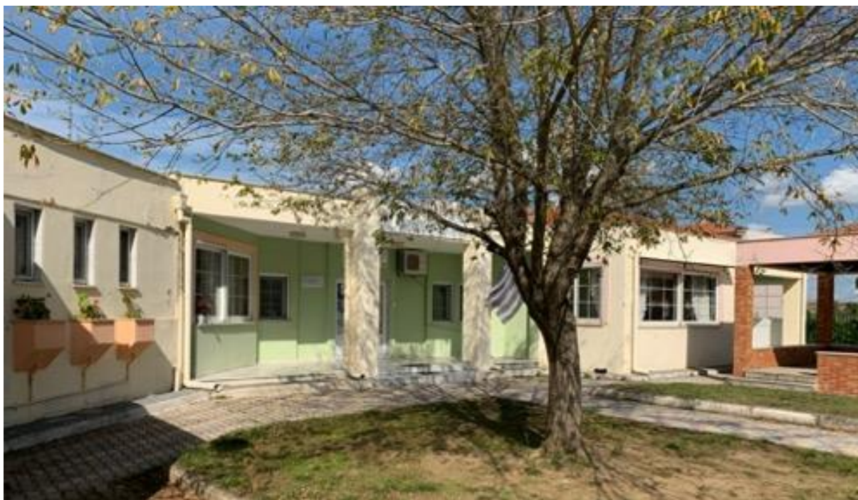
Εικόνα 1. Α' Βρεφονηπιακός Σταθμός Διδυμοτείχου

Το κτήριο είναι συνδεδεμένο στο δίκτυο Χαμηλής Τάσης (ΧΤ) της ΔΕΔΔΗΕ Α.Ε., παροχή τριφασική Νο2 (25kVA). Στο κτήριο εντοπίζεται γενικός πίνακας χαμηλής τάσης, ο οποίος περιλαμβάνει κυκλώματα καταναλώσεων αλλά και υποπίνακες. Εντοπίζονται υποπίνακες στους χώρους του κτηρίου. Λόγω της απουσίας σχεδίων της ηλεκτρολογικής εγκατάστασης επισημαίνεται η αδυναμία ακριβή καθορισμού της συνδεσμολογίας της υφιστάμενης ηλεκτρικής εγκατάστασης. Σε κάθε περίπτωση, οι καταναλώσεις του κτηρίου εξυπηρετούνται από τον εκάστοτε πλησιέστερο υποπίνακα με ηλεκτρικές γραμμές, η όδευση των οποίων δεν είναι πλήρως γνωστή καθώς ίσως έχουν πραγματοποιηθεί μεταγενέστερες παρεμβάσεις.